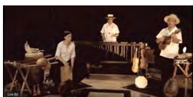
TriOrganico #musica latinoamericana